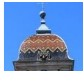
clocher de Pesmes

Proverbe : « Qui n'entend qu'une cloche n'entend qu'un son » : on ne peut juger d'une affaire si on n'a pas entendu la version de chaque partie.