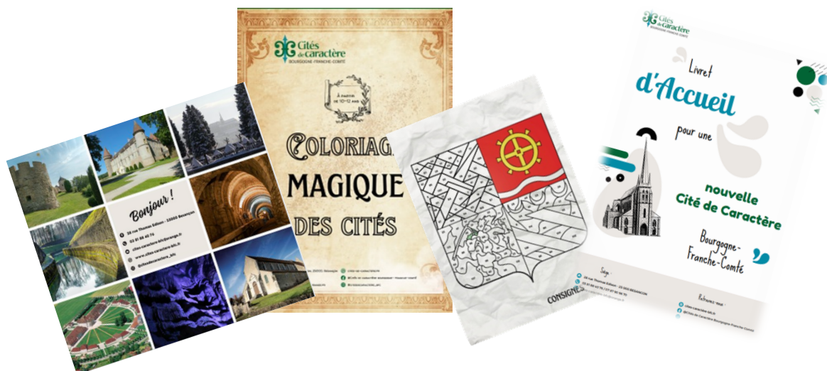
Quelques créations de Jade

Ses missions consistent à une aide au graphisme des pages communales sur le site internet, la reprise de la charte sur tous les supports papier (livrets jeux, d'accueil), animation et création de réseaux sociaux.