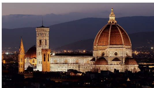
Cathédrale Santa Maria del Fiore Florence

L'architecture du dôme comtois serait également dérivée des coupoles de la Renaissance italienne. La diffusion du modèle s'affirme aux XVI e et XVII e siècles : un exemple est repérable dans la province de Franche-Comté avec le clocher-porche de la collégiale de Dole, achevé en 1596. L'architecture classique va offrir des réalisations de dômes célèbres comme à Paris avec la chapelle de la Sorbonne, l'église du Val-de-Grâce, la Coupole de Académie française ou l'Hôtel des Invalides.