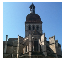
L'église Notre Dame de Beaune

L'autre caractéristique des clochers comtois, c'est le toit à la Bourguignonne, constitué de tuiles vernissées. C'est là un élément important, mais pas décisif de ce qui fait un clocher dit « comtois ». Le dôme de l'église de Beaune réalisé au XVI e , présentait déjà le toit à l'impériale.